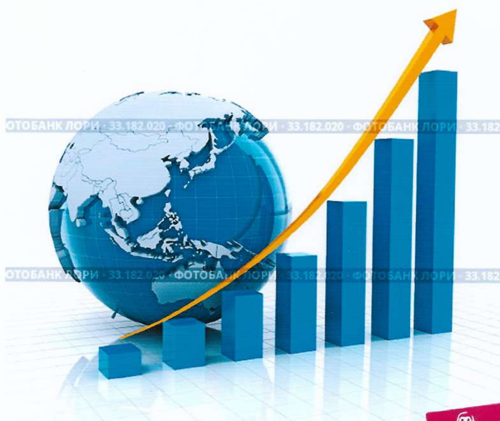
Growth chart with globe, 3d render